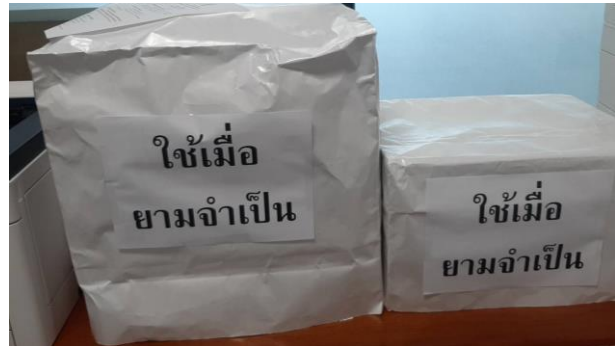
ภาพการจัดทำถุงกระดาษครอบเครื่องพิมพ์เอกสาร (Printer) ที่ชำรุดหรือไม่ได้ใช้งาน