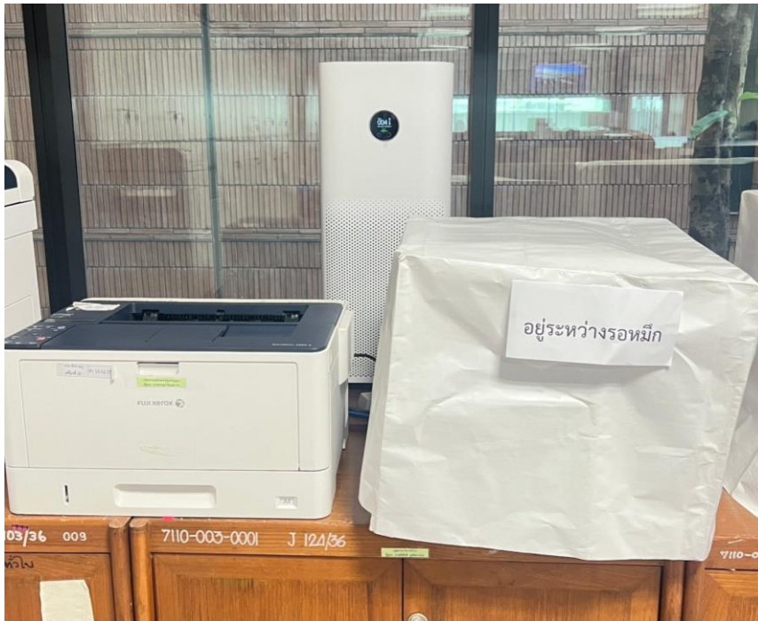
ภาพการติดตั้งเครื่องฟอกอากาศบริเวณเครื่องพิมพ์เอกสาร (Printer)