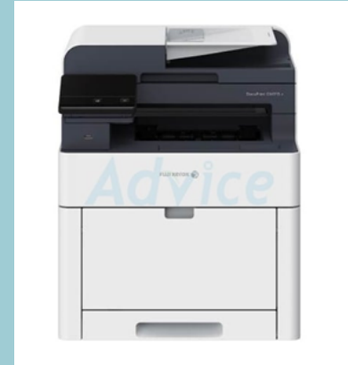
เครื่องพิมพ์ Fuji Xerox รุ่น DocuPrint CM315Z