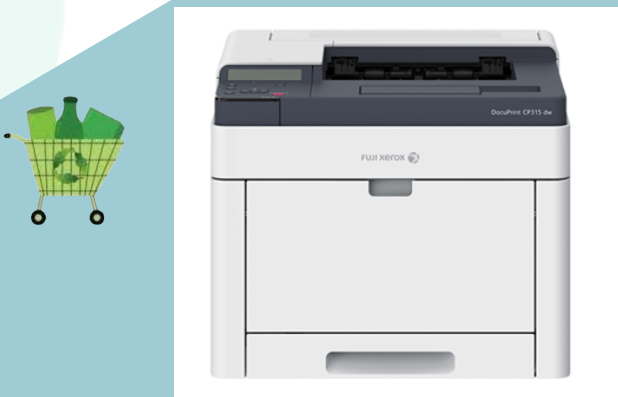
เครื่องพิมพ์ Fuji Xerox รุ่น DocuPrint CP315dw