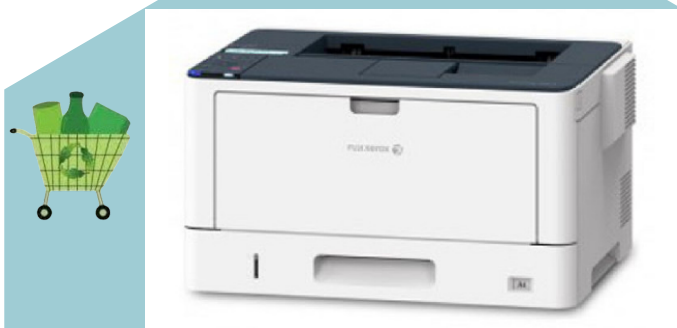
เครื่องพิมพ์ Fuji Xerox รุ่น DocuPrint 3505 d