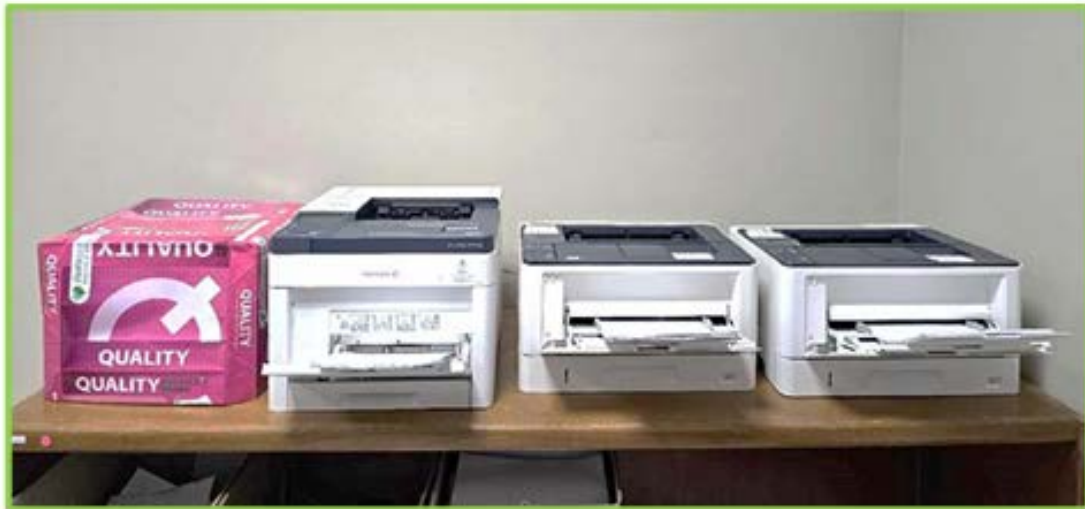
จุดวางเครื่องพิมพ์ กลุ่มงานสื่อมวลชน