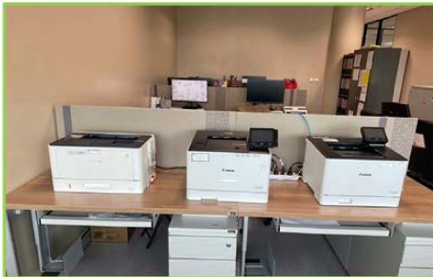
จุดวางเครื่องพิมพ์ กลุ่มงานสารสนเทศและศูนย์บริการ(Call Center) วุฒิสภา