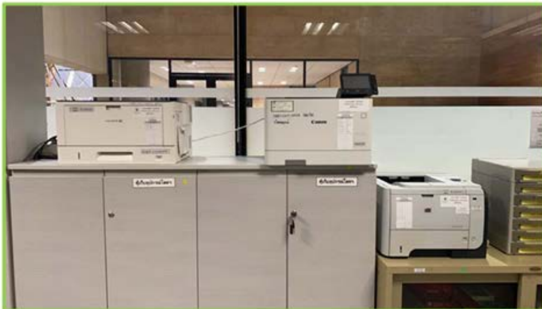
จุดวางเครื่องพิมพ์ กลุ่มงานโสตทัศนูปกรณ์