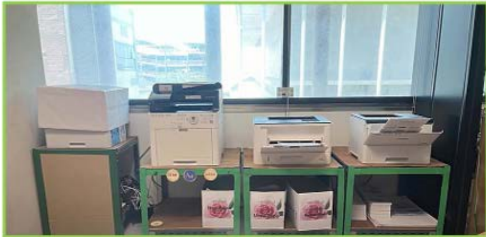
จุดวางเครื่องพิมพ์ กลุ่มงานบริหารทั่วไปและพิธีการ

สำนักประชาสัมพันธ์ มีการกำหนดจุดใช้เครื่องพิมพ์ร่วมกัน (Share Printer) ในกลุ่มงาน โดยมีการจัดวางเครื่องพิมพ์ห่างจากผู้ปฏิบัติงาน เพื่อลดความสิ้นเปลืองทั้งด้านพลังงานและการซ่อมบำรุง