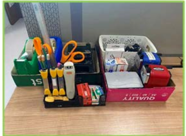
2. กลุ่มงานสารสนเทศและศูนย์บริการ (Call Center) วุฒิสภา