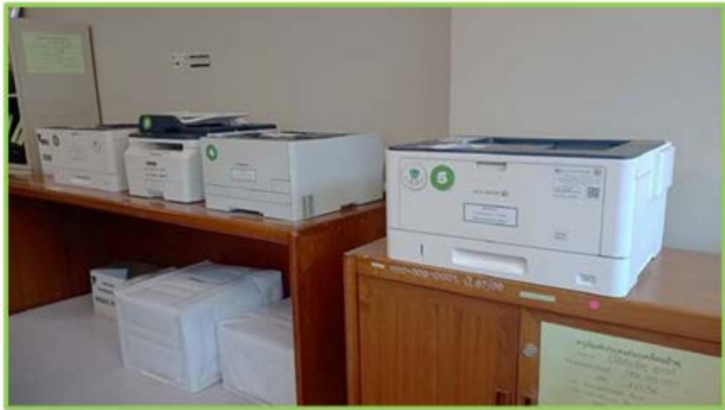
จุดวางเครื่องพิมพ์ กลุ่มงานผลิตเอกสารเผยแพร่