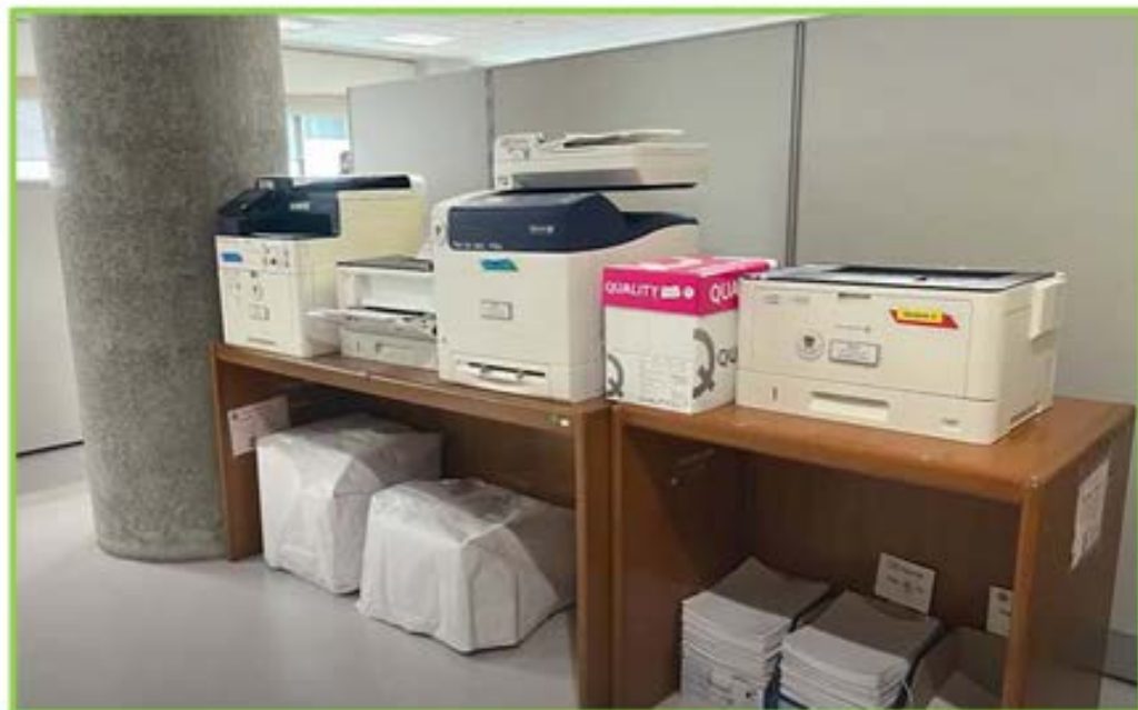
จุดวางเครื่องพิมพ์ กลุ่มงานเผยแพร่ประชาสัมพันธ์และกิจกรรมวุฒิสภาภูมิภาค