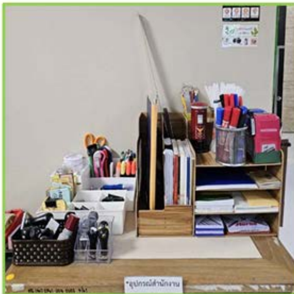
3. กลุ่มงานสื่อมวลชน