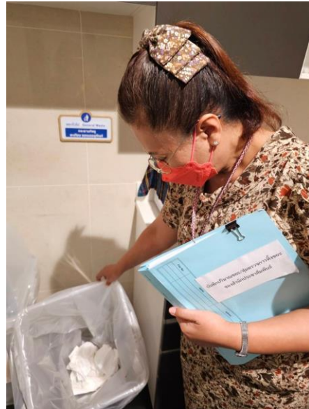
สุ่มตรวจขยะทั่วไป