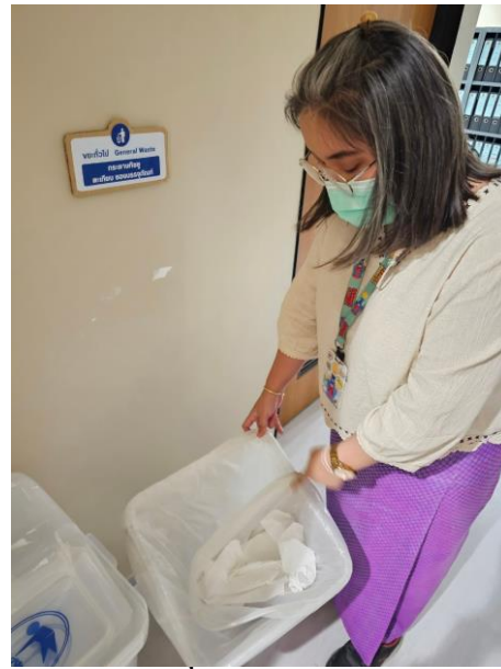
จุดที่ ๑ บริเวณหน้าห้องครัว สำนักประชาสัมพันธ์ ชั้น ๒