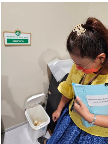
สุ่มตรวจขยะเศษอาหาร

จุดที่ ๑ ภายในห้องครัว กลุ่มงานสารสนเทศและศูนย์บริการ (Call Center) วุฒิสภา ชั้น ๑