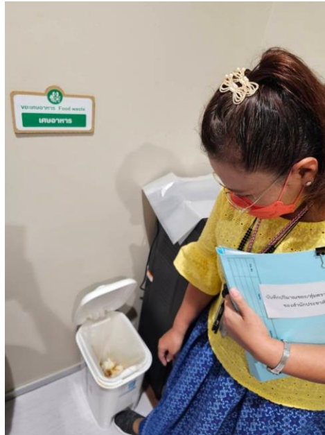
ผู้ตรวจสอบขยะเศษอาหาร จุดที่ ๒ ภายในห้องครัว สำนักประชาสัมพันธ์ ชั้น ๒