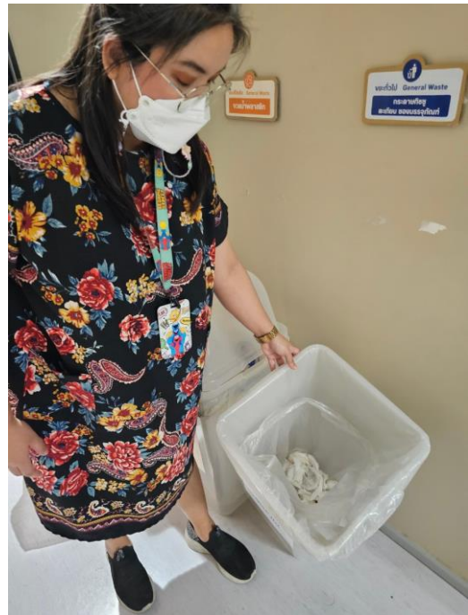
สุ่มตรวจขยะทั่วไป

จุดที่ ๑ บริเวณหน้าห้องครัว สำนักประชาสัมพันธ์ ชั้น ๒