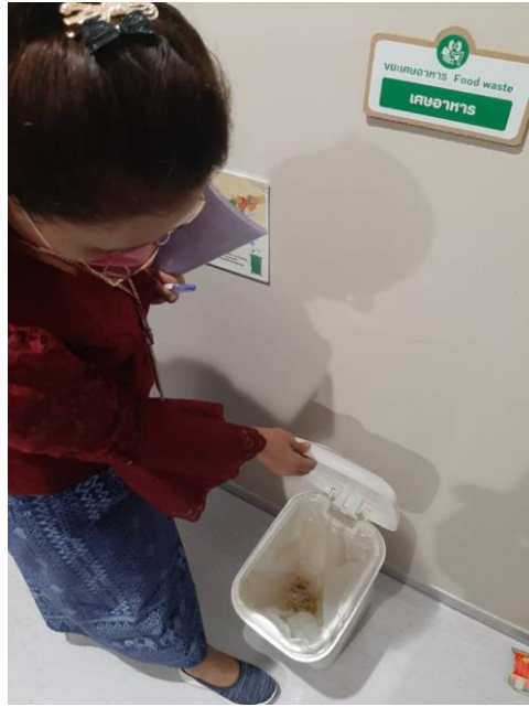
กลุ่มตรวจขยะเศษอาหาร จุดที่ ๒ ภายในห้องครัว สำนักประชาสัมพันธ์ ชั้น ๒