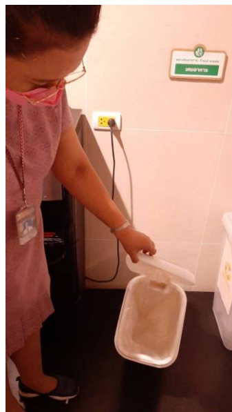
สุ่มตรวจขยะเศษอาหาร

จุดที่ ๑ ภายในห้องครัว กลุ่มงานสารสนเทศและศูนย์บริการ (Call Center) วุฒิสภา ชั้น ๑