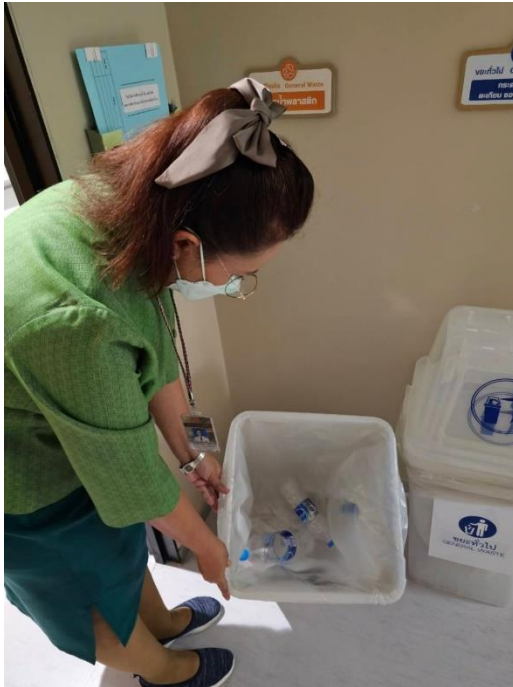
สุ่มตรวจขยะรีไซเคิล