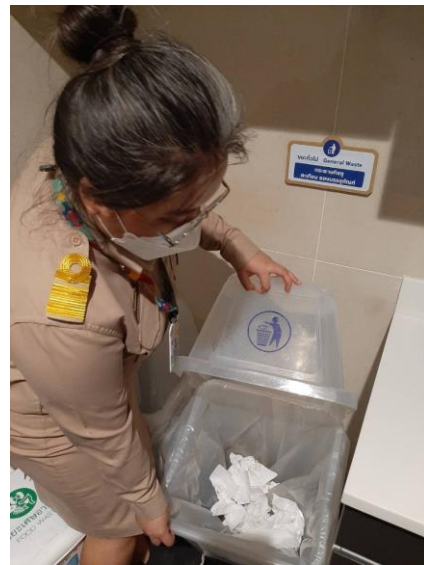
สุ่มตรวจขยะทั่วไป