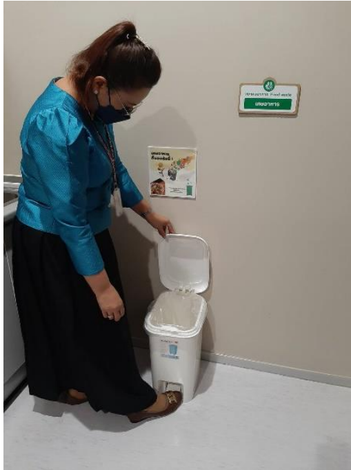
กลุ่มตรวจขยะเศษอาหาร จุดที่ ๒ ภายในห้องครัว สำนักประชาสัมพันธ์ ชั้น ๒