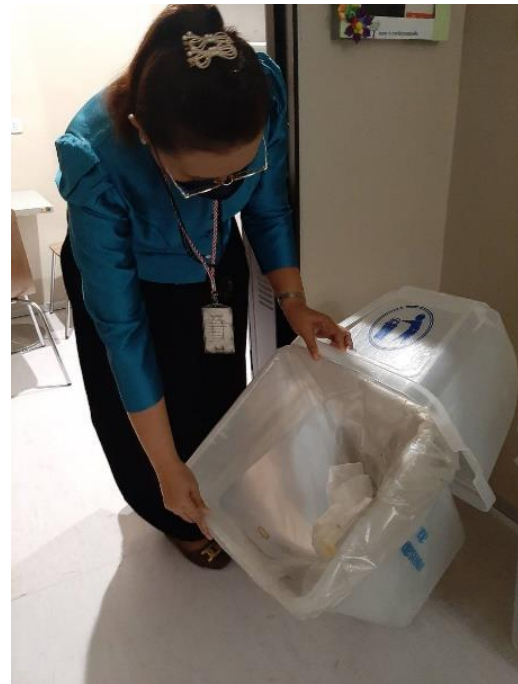
สุ่มตรวจขยะทั่วไป

จุดที่ ๒ บริเวณด้านหน้าห้องครัว สำนักประชาสัมพันธ์ ชั้น ๒