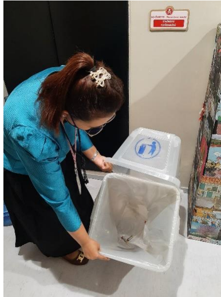
กลุ่มตรวจขยะอันตราย จุดที่ ๔ ภายในห้องครัว กลุ่มงานสื่อมวลชน ชั้น ๑