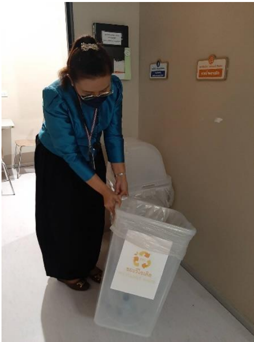
สุ่มตรวจขยะรีไซเคิล