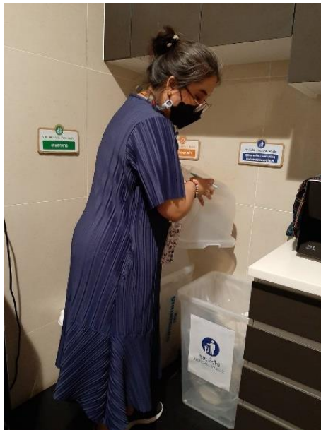
สุ่มตรวจขยะทั่วไป