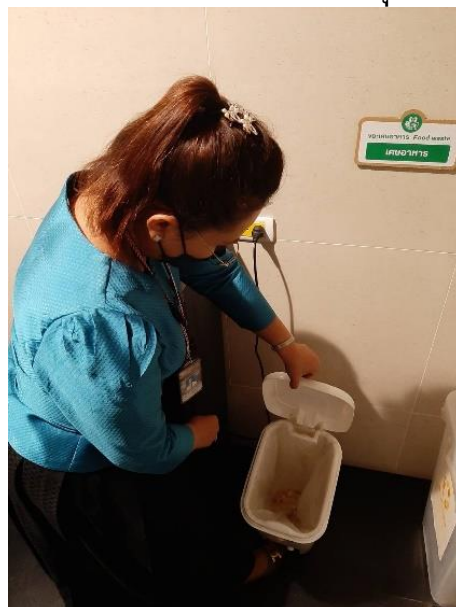
สุ่มตรวจขยะเศษอาหาร

จุดที่ ๑ ภายในห้องครัว กลุ่มงานสารสนเทศและศูนย์บริการ (Call Center) วุฒิสภา ชั้น ๑