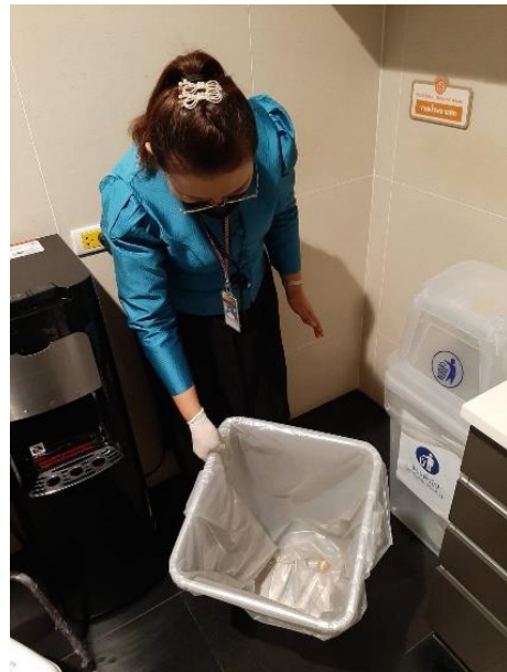
สุ่มตรวจขยะรีไซเคิล